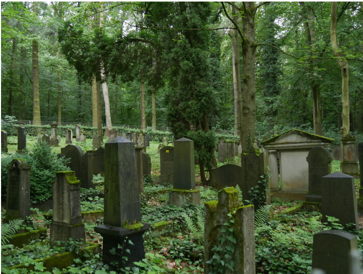
Grabsteine auf dem jüdischen Friedhof am Schafsberg in Limburg (2017)