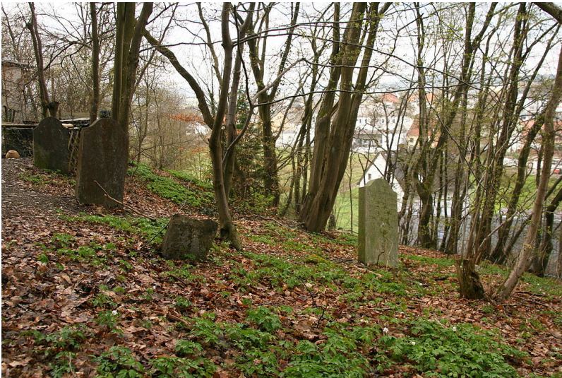
Der jüdische Friedhof Mühlhecke in Heidenrod-Laufenselden (2012).