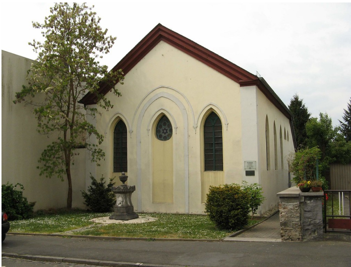
Die ehemalige Synagoge Nonnengasse in Hadamar (2007).