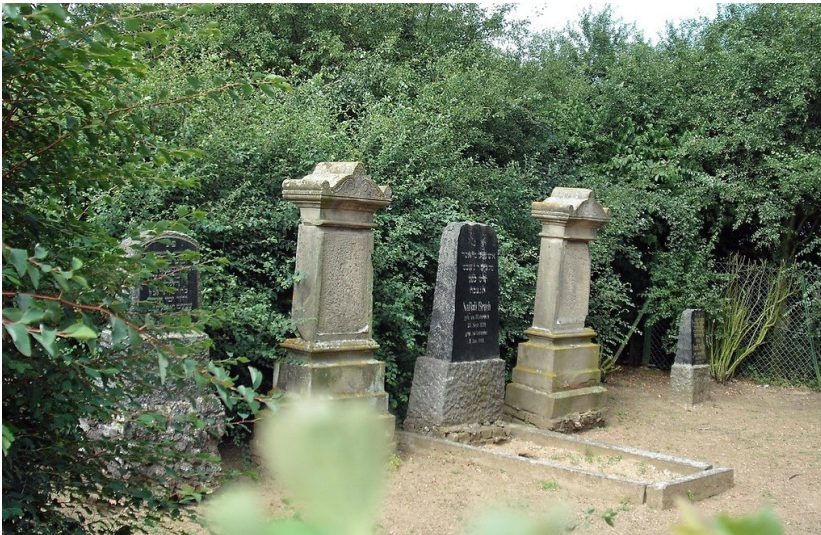
Jüdischer Friedhof an der Pflingstweide bei Kettenheim, Gemeinde Vettweiß (2009)