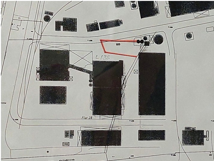
In einem Katasterplan 1998 in rot eingezeichnete Lage des Jüdischen Friedhofs Uerdingen auf dem späteren Werks Gelände der Bayer AG, zur NS-Zeit Teil der früheren I. G. Farben. Aus einer Akte, in der die damalige Überbauung der Fläche als Friedhofschändung behandelt wird.