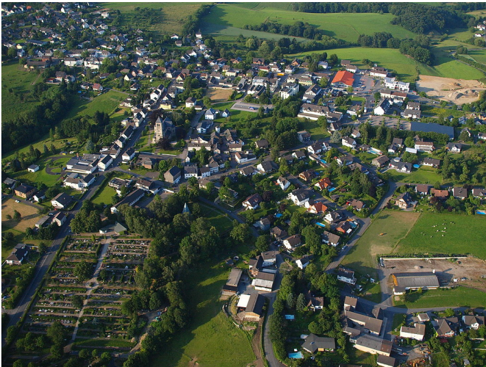
Luftaufnahme der Ortschaft Uckerath, Ortsteil der Stadt Hennef (Sieg) im Rhein-Sieg-Kreis (2012), Blick in nordöstliche Richtung entlang der Lichstraße.