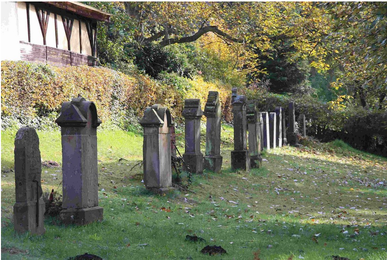
Gräberfeld auf dem jüdischen Friedhof zwischen Kerpen-Türnich und Kerpen-Brüggen (2010).