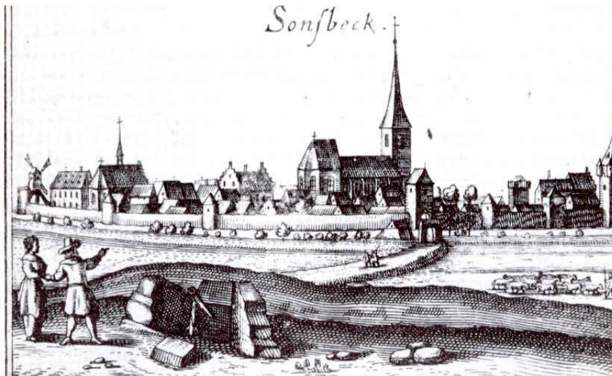
Historischer Stich mit einer Ansicht von Sonsbeck; Ansicht vermutlich aus westlicher Richtung, links im Bild sind Gebäude des früheren Andreasklosters zu sehen (undatiert).