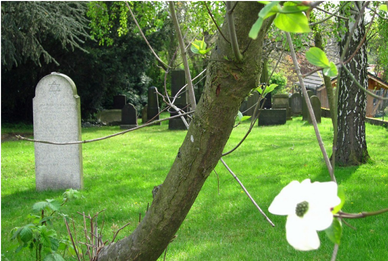
Jüdischer Friedhof Stommeln (2012).