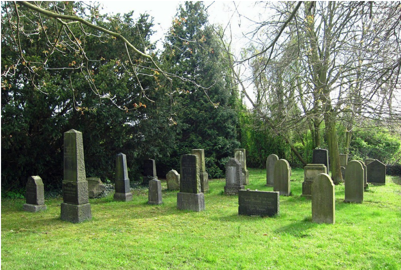
Jüdischer Friedhof Stommeln (2012).