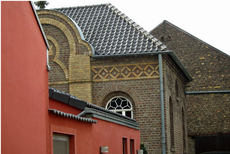
Das Gebäude der Synagoge in Stommeln (2012).