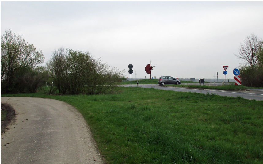
Der Verkehrskreisel bei Pulheim-Sinnersdorf mit der Einmündung der Roggendorfer Straße in die Landstraße L 183 (2016).