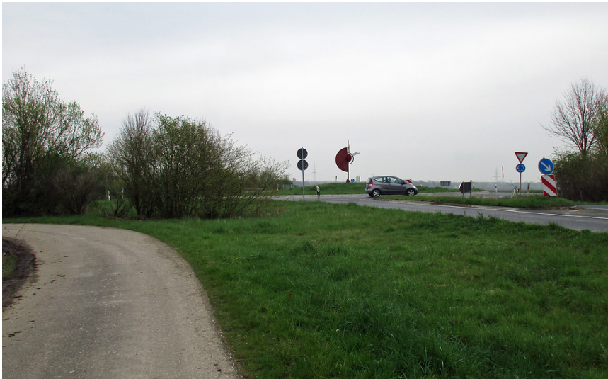
Der Verkehrskreisel bei Pulheim-Sinnersdorf mit der Einmündung der Roggendorfer Straße in die Landstraße L 183 (2016).