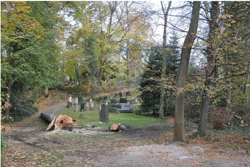
Der jüdische Friedhof in der Heinrichstraße in Siegburg. Da das Gelände nicht frei zugänglich ist (2011), wurde das Foto von der Straßenseite aus einiger Entfernung aufgenommen.