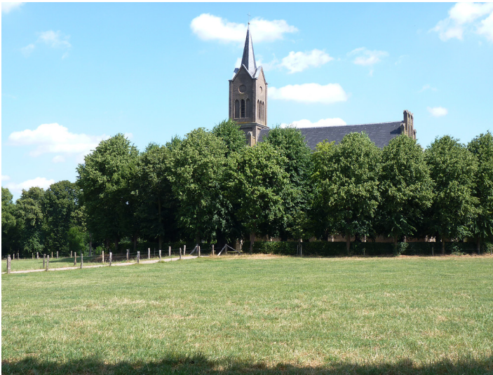
Bedburg-Hau-Louisendorf, Ev. Elisabethkirche, Louisenplatz 1