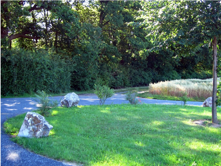
Jüdischer Friedhof Schweinheim, Eingangsbereich (2012)