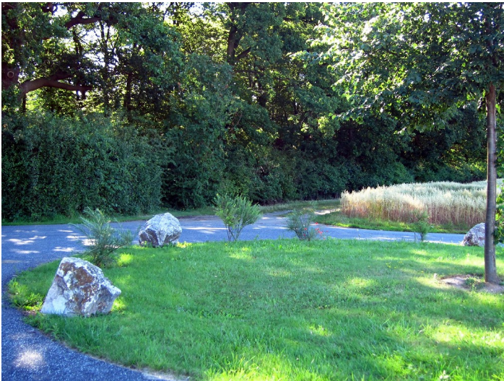
Jüdischer Friedhof Schweinheim, Eingangsbereich (2012)