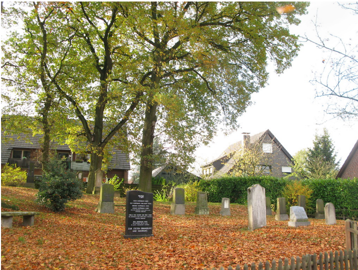
Gräberfeld auf dem jüdischen Friedhof am Bösenberg / Gartenstraße in Schermbeck (2008).