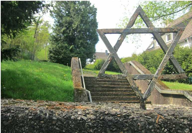
Blick über die Friedhofsmauer des jüdischen Friedhofs in der Herchener Straße in Ruppichteroth (2014)