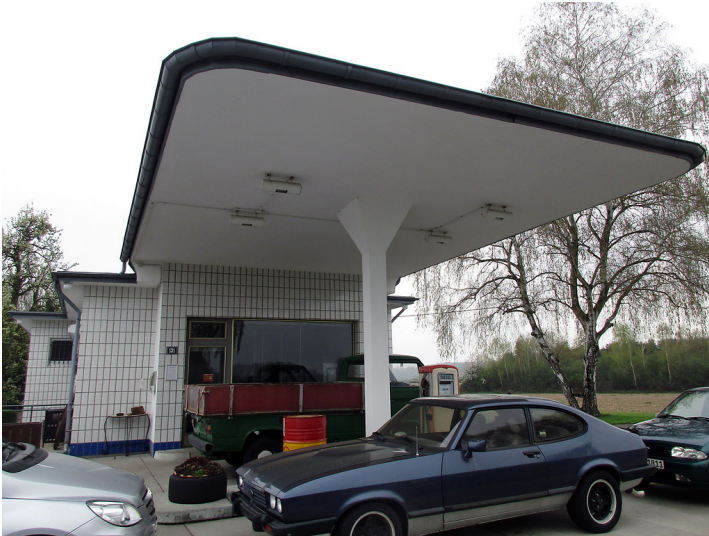
Die historische Tankstelle an der alten Neusser Landstraße südöstlich von Köln-Worringen (2016).