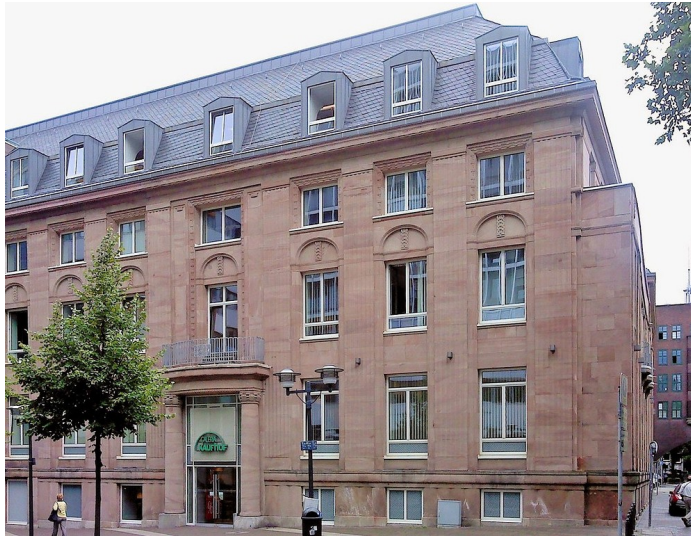
Gebäude des Bankhauses Hirschland (2011), heute "Galeria Kaufhof". 1910/11 erbaut nach Plänen von Carl Moritz.