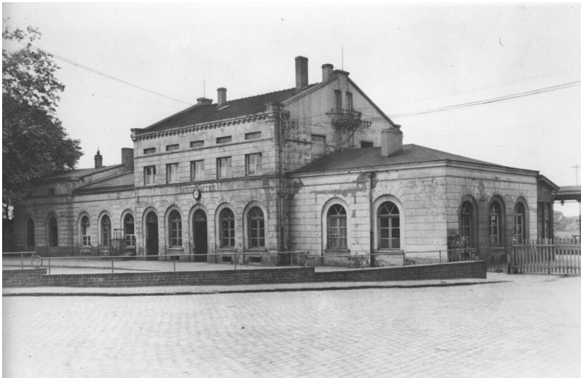
Bahnhof Horrem, Empfangsgebäude (um 1910).