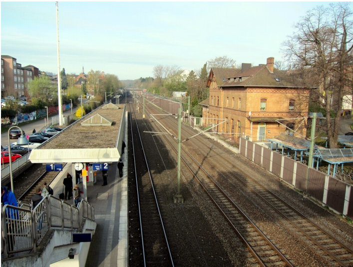
Bahnhof Frechen-Königsdorf (2015)