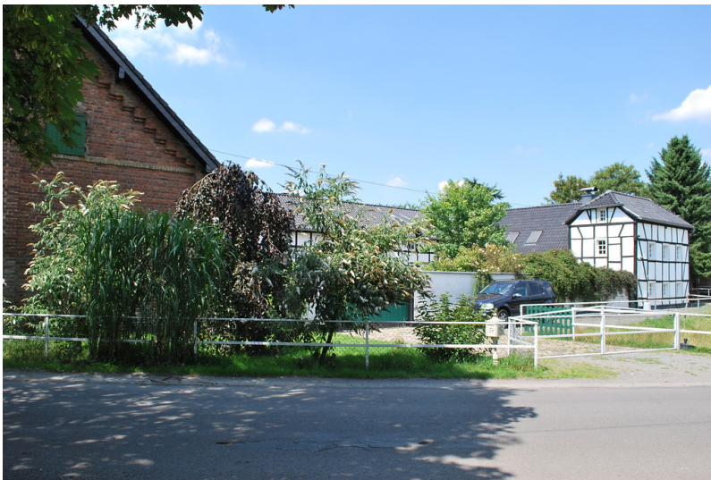
Hardthof in Dellbrück (2014)