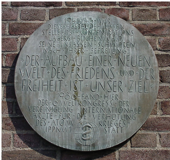
Am alten Köln-Deutzer Messeturm angebrachte Plakette, deren Aufschrift an verschiedene Ereignisse in der Geschichte der Rheinhallen erinnert (2003).