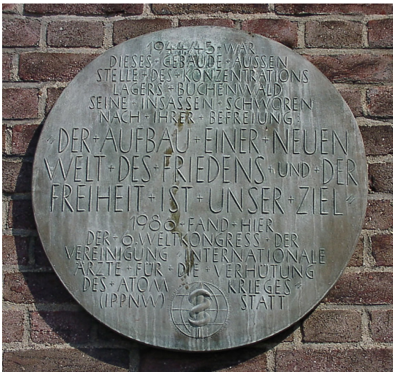
Am alten Köln-Deutzer Messeturm angebrachte Plakette, deren Aufschrift an verschiedene Ereignisse in der Geschichte der Rheinhallen erinnert (2003).