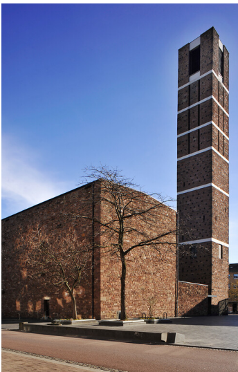
Sankt Anna Kirche in Düren (2014)