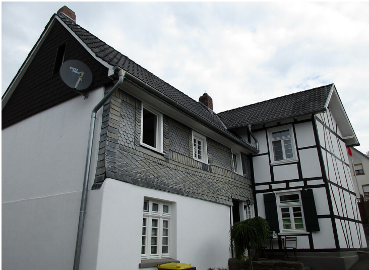
Fachwerkwohnhaus im Bereich des früheren Standorts der 1938 zerstörten Synagoge in der Bergstraße in Windeck-Rosbach (2021).