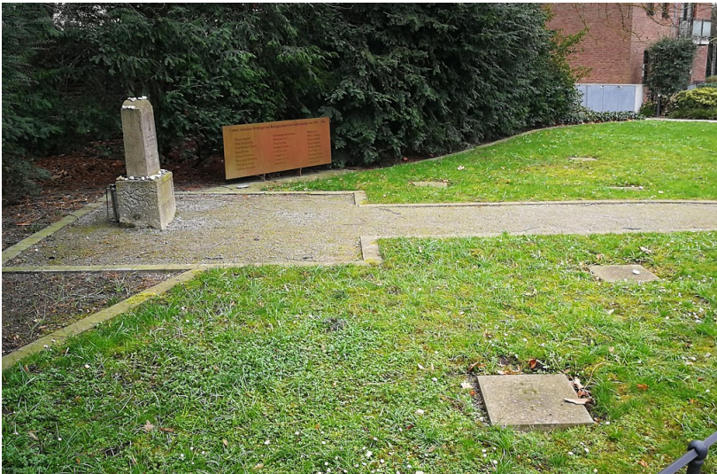
Jüdischer Friedhof Werdener Straße in Ratingen (2019): Die Erinnerungs- und Gedenkstätte in der 2013 neu eingerichteten Grünanlage.