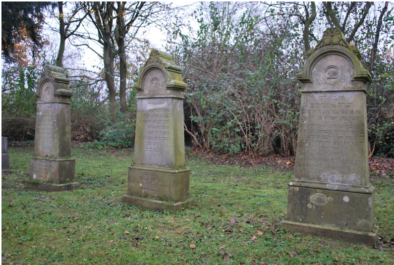
Jüdischer Friedhof in Bergheim-Paffendorf (2015)