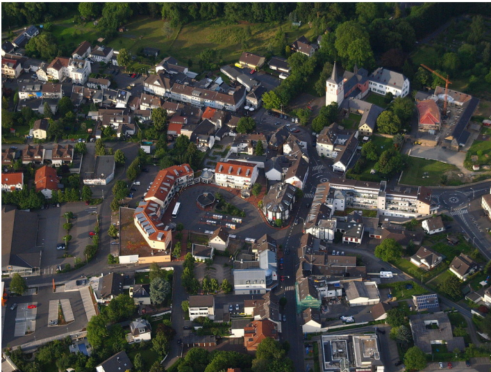
Luftaufnahme der Ortschaft Königswinter-Oberpleis im Rhein-Sieg-Kreis (2012).