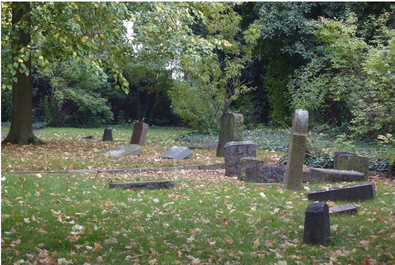
Blick auf das Gräberfeld des jüdischen Friedhofs in der ehemaligen Ladestraße in Rheinbach (2010).