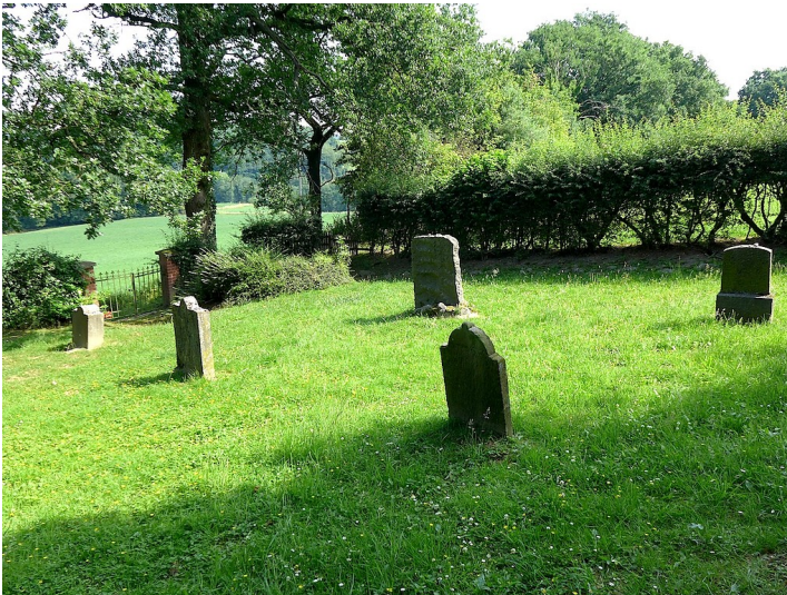
Das Gräberfeld auf dem jüdischen Friedhof "am Kuhlendahl" im Zwingenberger Weg in Velbert-Neviges (2015).