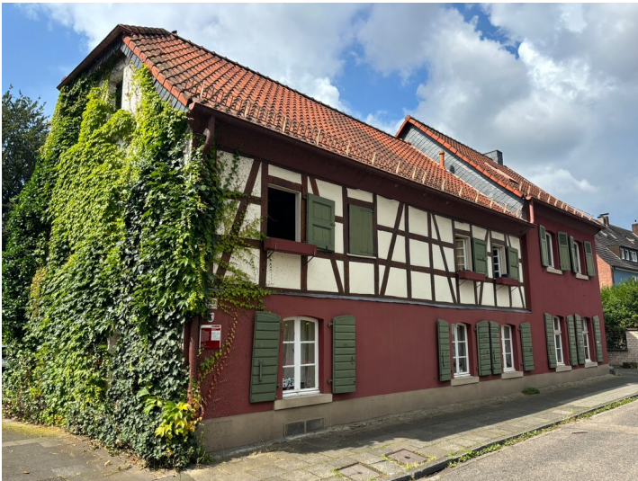
Grülshof in Merheim (2024)

Schlagwörter: Hof (Landwirtschaft), Schulgebäude Fachsicht(en): Kulturlandschaftspflege, Landeskunde Gemeinde(n): Köln Kreis(e): Köln Bundesland: Nordrhein-Westfalen