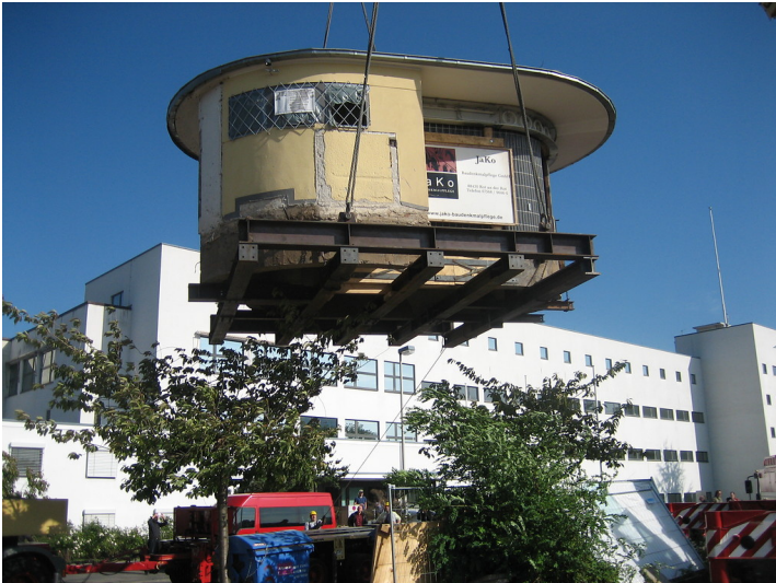
Ein Kran hebt das denkmalgeschützte "Bundesbüchchen", einen Kiosk im Bonner Regierungsviertel an, um diesen zu seinem Zwischenlager, einem Bauhof in Hersel, transportieren zu können (2006).