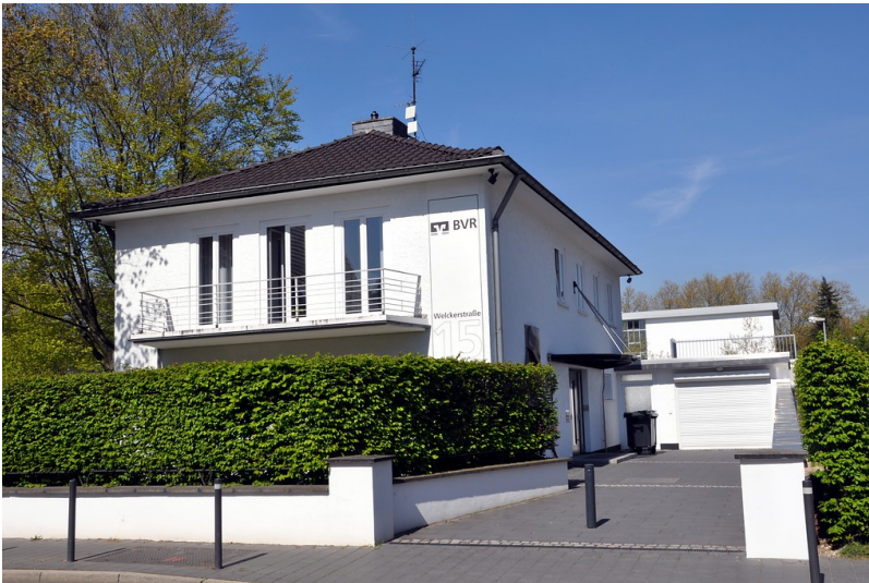
Wohn- und Bürohaus Welckerstraße 15 in Bonn (2015)