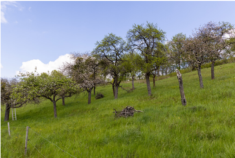
Streuobstwiese in Hanglage bei Sinzig-Westum (2021)