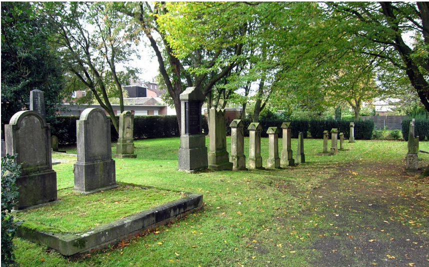
Grabmale auf dem jüdischen Friedhof am Kreuzweg in Krefeld-Linn (2014).