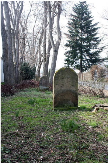
Blick auf den alten jüdischen Friedhof Mühlenstraße (An der Schleifmühle) in Erftstadt-Lechenich (2009).