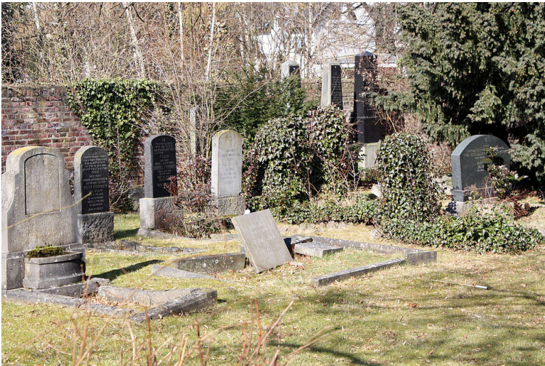
Blick auf das Gräberfeld auf dem jüdischen Friedhof am Römerhofweg in Erftstadt-Lechenich (2009).