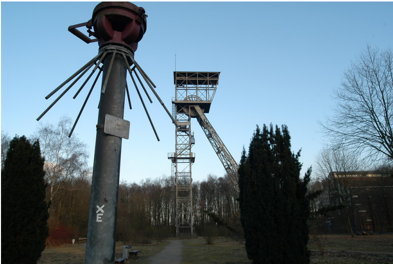
Zeche Teutoburgia (2006)