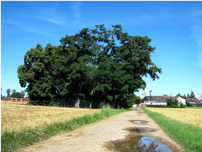
Jüdischer Friedhof in Kuchenheim (2012)