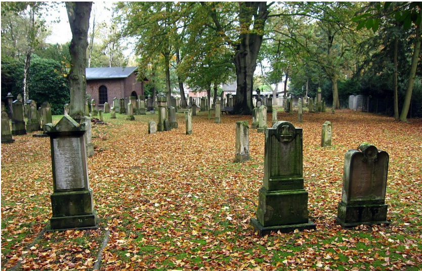
Grabmale und die Trauerhalle auf dem Alten Jüdischen Friedhof an der Heideckstraße in Krefeld (2014).