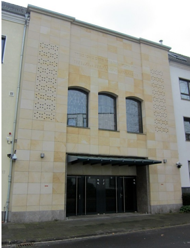
Die neue Synagoge in der Wiedstraße in Krefeld (2014).