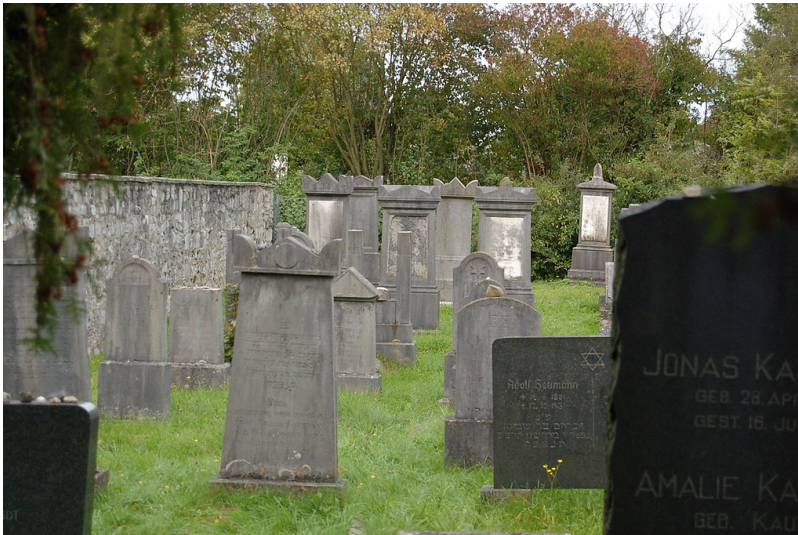
Grabmale auf dem jüdischen Friedhof Schildchenweg in Aachen-Kornelimünster (2011)