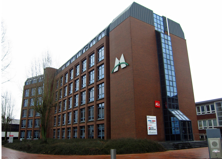
Geschäftsgebäude auf dem Gelände der Oerlikon-Schlafhorst AG in Mönchengladbach (2015), in diesem Bereich befand sich früher der alte jüdische Friedhof "am Grünen Weg".