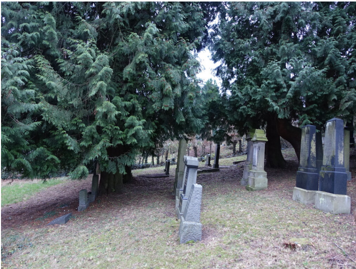
Gräberfeld jüdischer Friedhof Mehlem