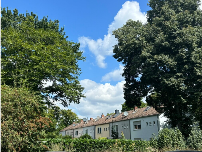
Besatzungssiedlung Dellbrück (2024)