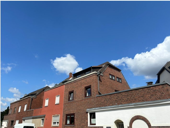
Siedlung der Kinderreichen in Dellbrück (2024)