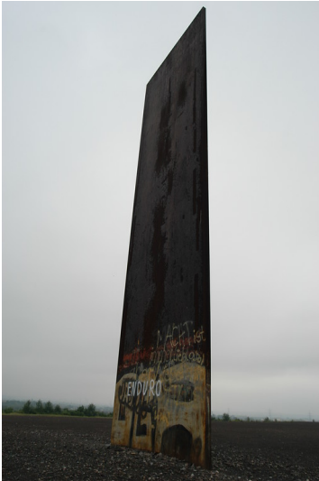
Kunstinstallation "Bramme für das Ruhrgebiet" auf der Schurenbachhalde in Essen (2005)