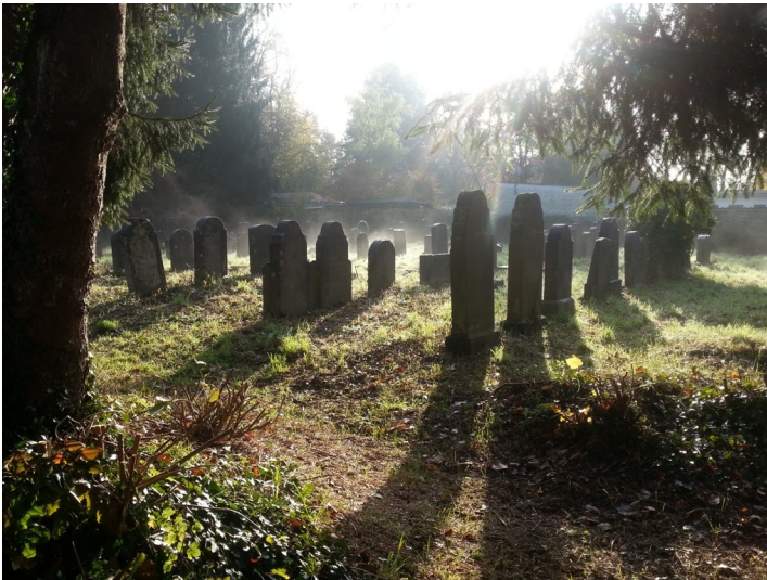
Das Gräberfeld auf dem jüdischen Friedhof in Deckstein, Köln-Lindenthal, im Morgennebel (2013)