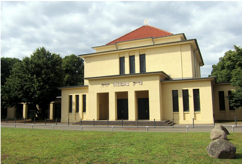
Eingangsgebäude des Neuen Jüdischen Friedhofs in der Venloer Straße (2013)